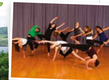
Fancy dance dance in Bootham School's dance studio?