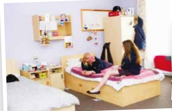
The student dorms are all site and only minutes away from all the classes/activities and city centre! Breakfast, lunch pack up and evening meal is included.