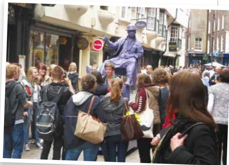
York's old streets with eccentric Englishman!

Unsere 'Embrace England Sprachferien' wurden ins Leben gerufen, um Schüler zu einem ein- oder zweijährigen Aufenthalt am York College/ Bootham School in York zu inspirieren. Die Teilnahme an den Sprachferien steht jedoch allen Schülern offen, die ihr Englisch verbessern und die Kultur Englands kennenlernen möchten, ohne jegliche Verpflichtung sich, für einen bestimmten Studienaufenthalt bewerben zu müssen. Obwohl unsere Sprachreise KEINE Vorbedingung für einen Aufenthalt am York College/Bootham School ist, sind die Vorteile eines solchen Aufenthalts in den Ferien am Strand.