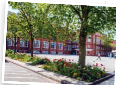
Bootham School... Hogwarts!!

Außerdem bieten wir zahlreiche Sport- und Abendveranstaltungen, so dass bestimmt keine Langeweile aufkommt und die Jugendlichen fast rund um die Uhr betreut sind. Dabei ist es uns wichtig, dass die Teilnehmer so oft wie möglich aus verschiedenen Freizeitangeboten wählen können, um verschiedenen Interessen gerecht zu werden. Wir unterscheiden deshalb zwischen Gruppenaktivitäten für alle Teilnehmer (diese beinhalten z.B. alle Ausflüge) und wählbaren Aktivitäten.