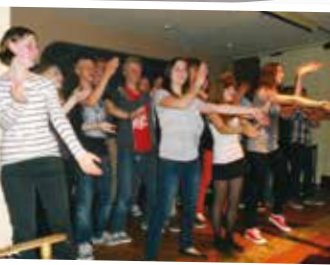
Club Night...We can dance!