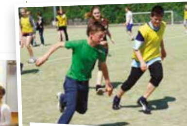
Fancy a game of football on Bootham School's pitches?