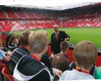
Manchester United Football Club