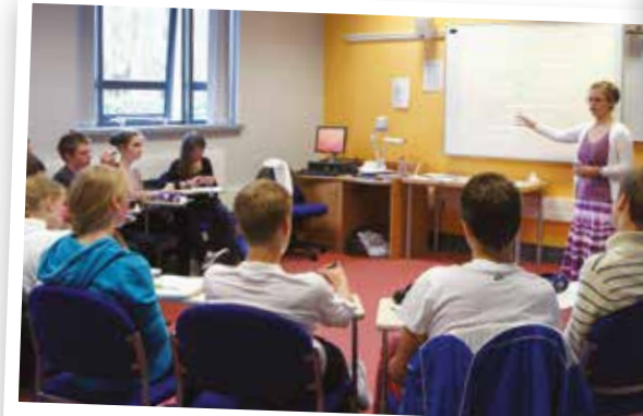
Over 30 hours teaching in small classes.