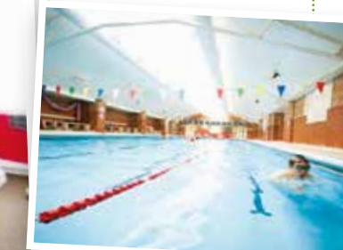
Fancy a dip in Bootham School's swimming pool?