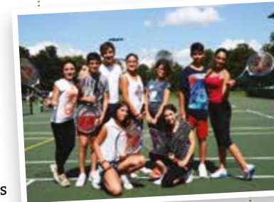
Fancy a game of tennis on Bootham School's tennis courts?